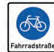
Beginn der Fahrradstraße