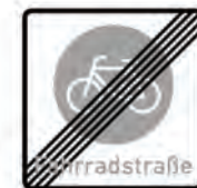
Ende der Fahrradstraße