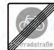
Ende der Fahrradstraße