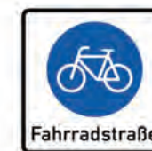
Beginn der Fahrradstraße